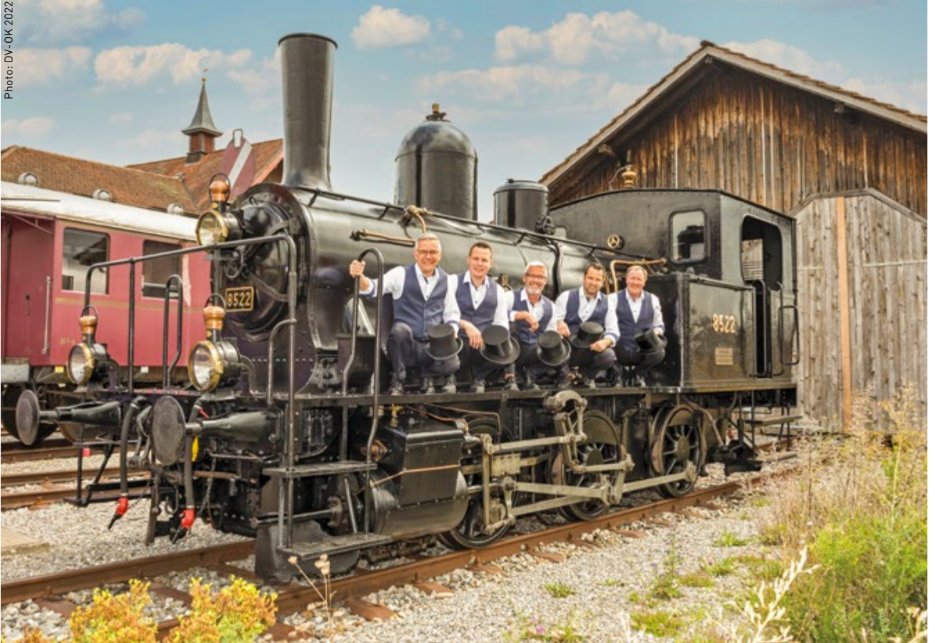
Le comité d'organisation lucernois de l'AD 2022.