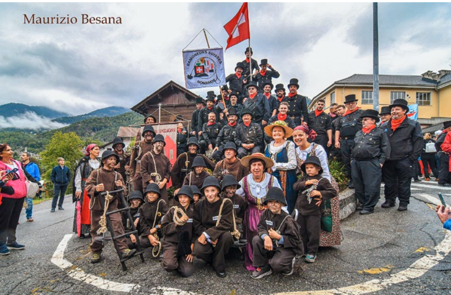
Santa Maria Maggiore 2022.