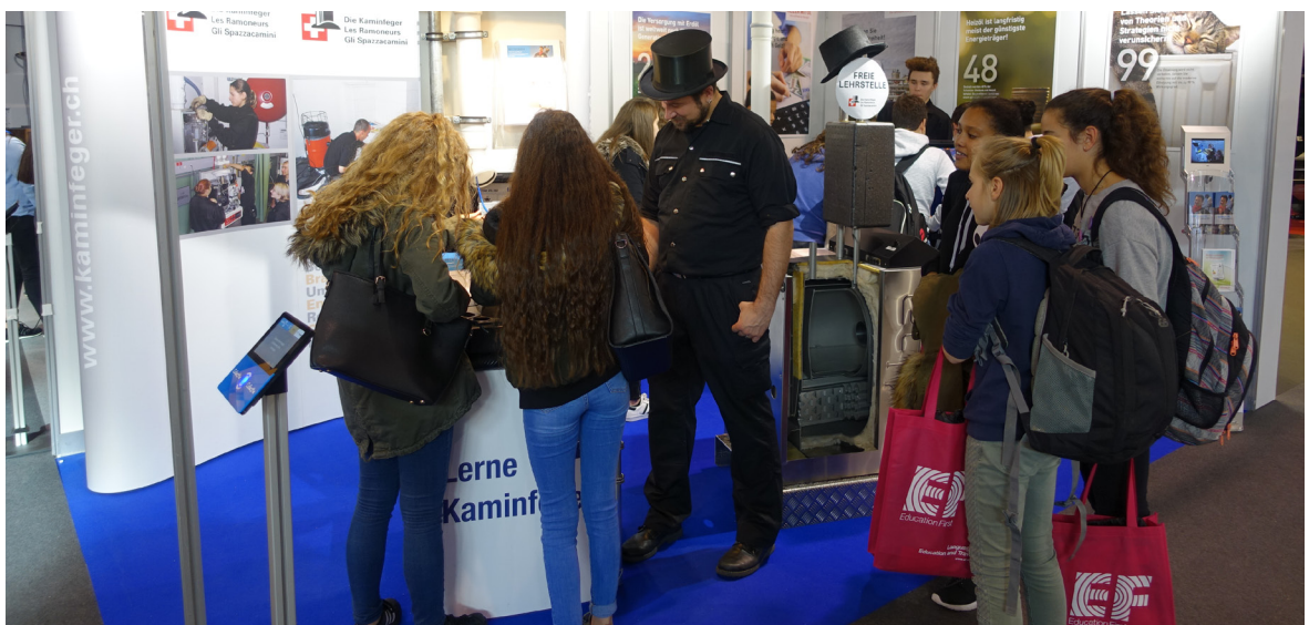
Bonne fréquentation du stand des ramoneurs au Salon des métiers à Zurich.