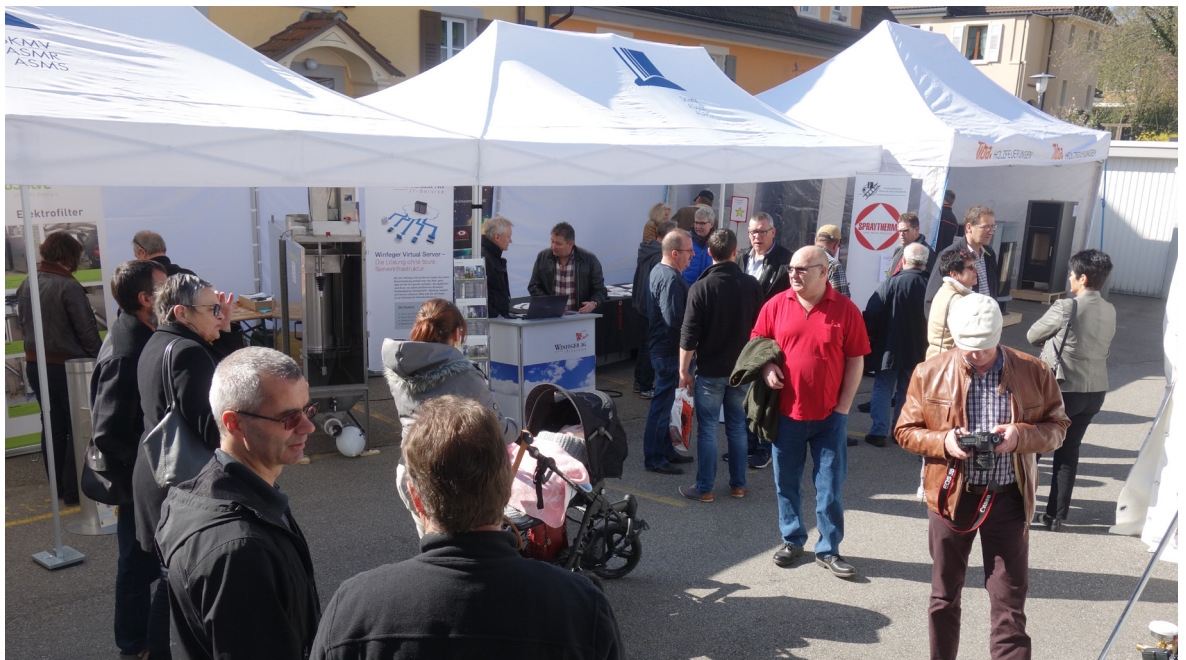
Le comptoir-maison est un événement très apprécié. De nombreux visiteurs et visiteuses s'informent sur les nouveaux produits.